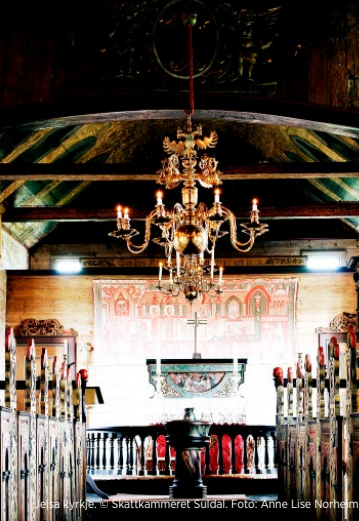
Jelsa kyrkje.