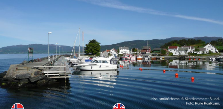
Jelsa småbåthamn.