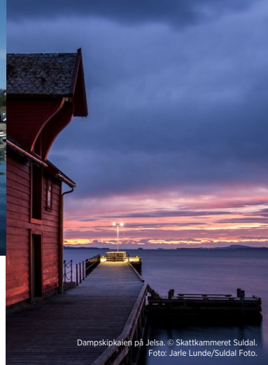
Dampskipkaien på Jelsa.

Jelsa church originates from 1647, and its carvings and hand-painted starlit ceiling make it one of the most beautiful churches in the area. The School Museum at Sandane was first built in 1774 and is a clear symbol of the important role that Jelsa played in education in the Ryfylke area. Both the church and the School Museum are open on selected days.