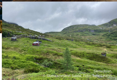
Slette dalen