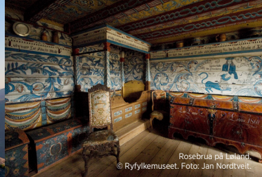
Rosebrua på Løland

Vanvik has a public bathing area called Sandvikjå, which offers seating for picnics, a barbecue area and a beach volleyball court, and all the way to Stavanger and Boknafjord. There are binoculars at the top that you can use to enjoy views of the beautiful fjords.