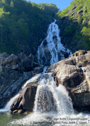
Den flotte Lingvongfossen