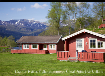
Lågatun Hytter.