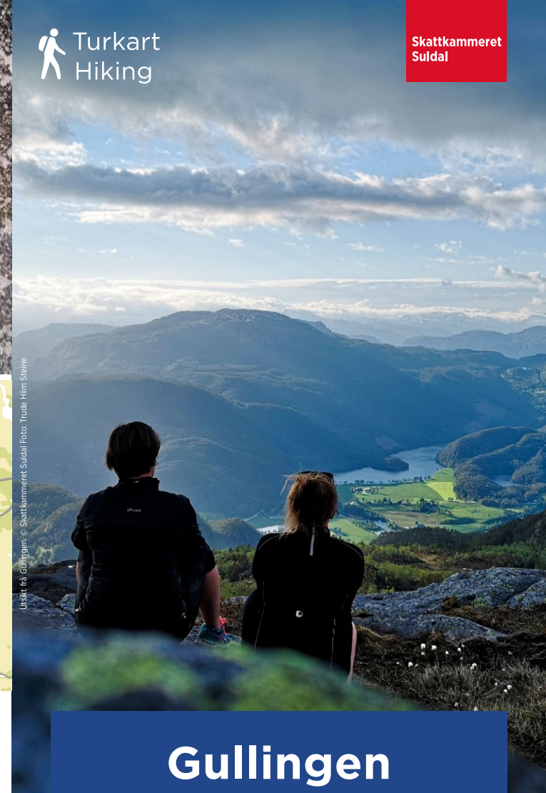
Utsikt frå Gullingen.

Gullingen Suldal sin portal til Ryfylkeheiane Suldal's gateway to the Ryfylke mountains